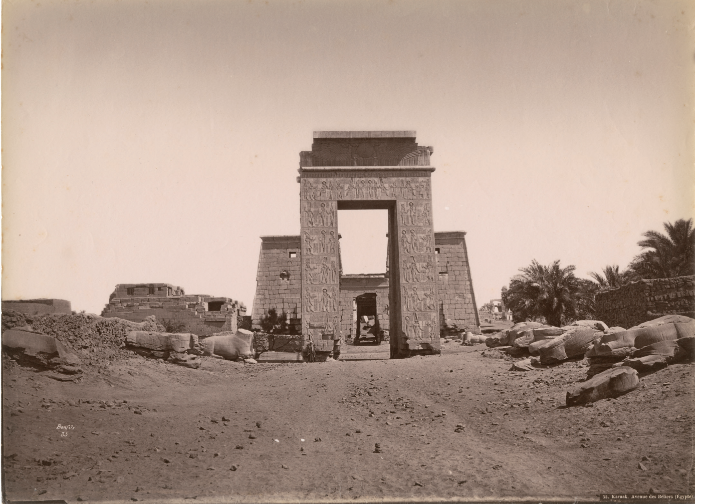
المصوّر منسوب إلى فيليكس بونفيس طريق الكباش، معبد الكرنك، مصر، قرابة ١٨٧٥-١٨٨٥ طباعة بالزلال