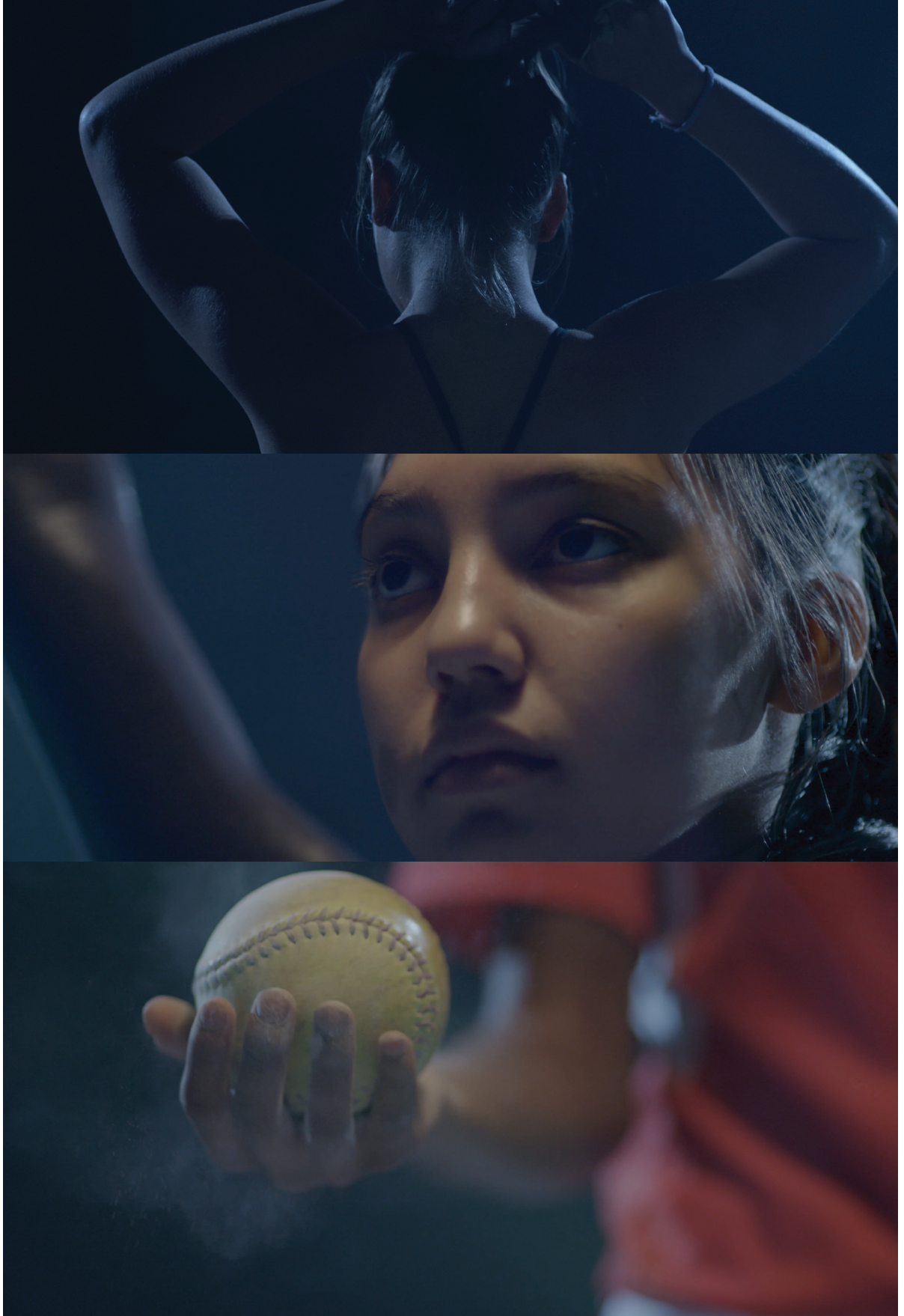
أدليتا حسني بي بعد خط النهاية، ٢٠١٥ فديو، بالألوان، صوت، في اللغة الإنكليزية مع ترجمة إلى العربية الحقوق للفنانة ولافيروناكا اركي كونتمبورينا