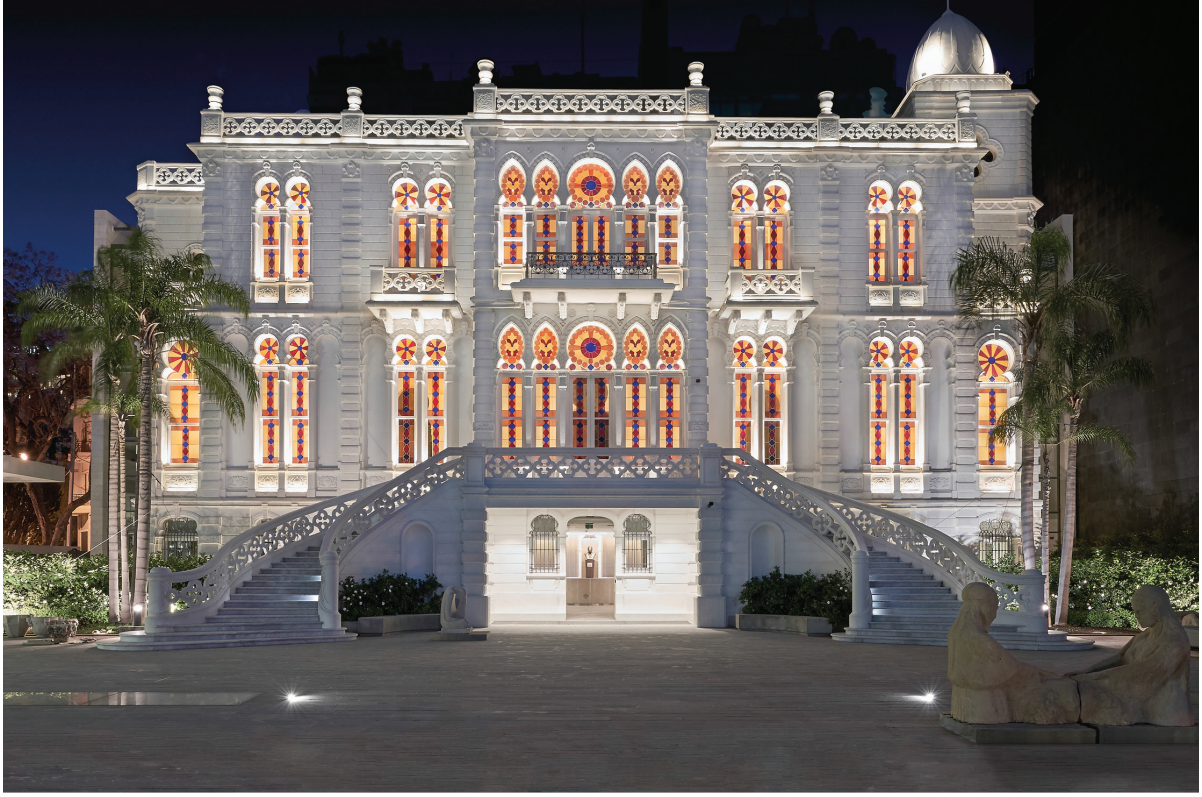
متحف سرسقي ليلاً